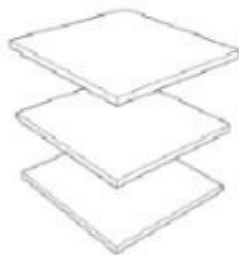
XO-SET3S-W SET OF 3 WOOD SHELVES SMALL