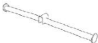
XO-DBF-M DOUBLE FACING 2X200 Ø18 WITH HANGER STOP