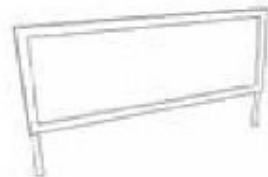
CO-HE-80-M HEADER METAL FRAM WOOD PANEL