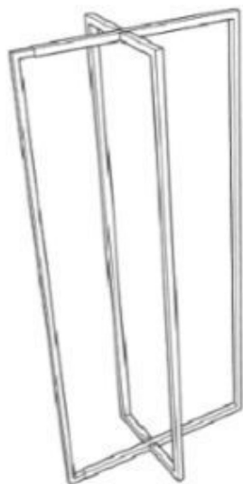
XO-170T-M-B TELESCOPIC RACK METAL