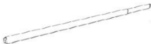
XO-CRT-M TELESCOPIC CROSSBAR