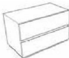
CO-CR-80-M WOOD CABINET WITH 2 DRAWERS