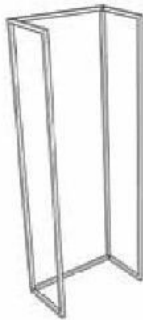
CO-80-M FOLDABLE FREESTANDING PERIMETRICAL DISPLAY